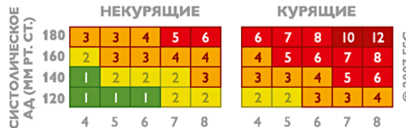
ОБЩИЙ ХОЛЕСТЕРИН ШКАЛА ОТНОСИТЕЛЬНОГО РИСКА

Для людей моложе 40 лет рекомендуется пользоваться Шкалой относительного риска. Шкала используется безотносительно пола и возраста человека и учитывает три фактора: систолическое (верхнее) артериальное давление, уровень общего холестерина и факт курения. Технология ее использования аналогична таковой для основной Шкалы SCORE.